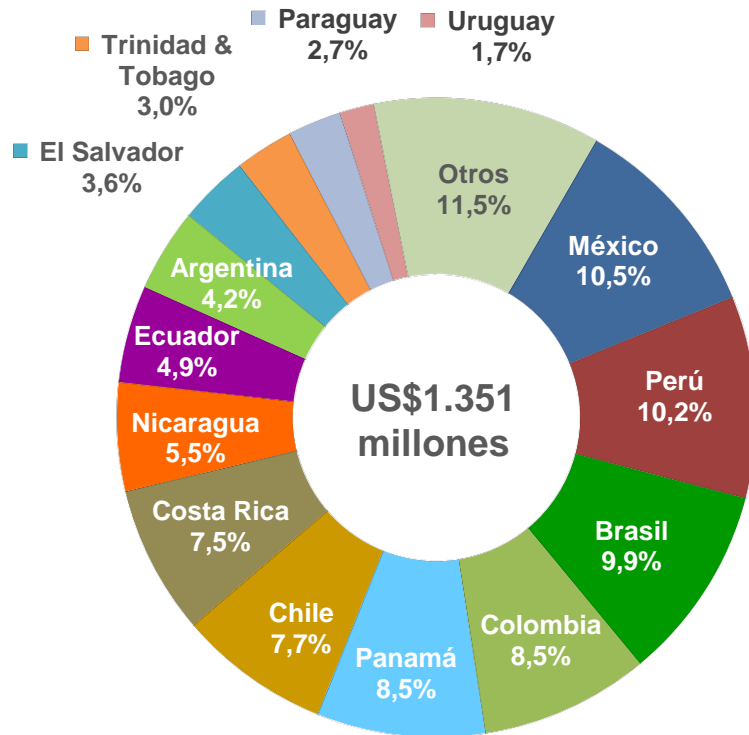
Composición por país